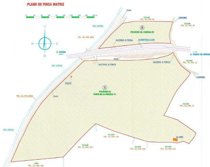
Plano de la finca matriz

Tal y como puede observarse en el plano de la finca matriz, ésta tenía una de superficie de 9.477 m 2 y 76.610 m 2 , al lado norte y sur de la carretera, respectivamente. La segregación operada dejó dividida la parte norte en dos porciones de 7.508 m 2 y 1969 m 2 , estando ambas vinculadas con las parcelas del lado sur.